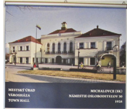
MESTSKÝ ÚRAD VÁROSHÁZA TOWN HALL MICHALOVCE (SK) NÁMESTIE OSLOBODITEĽOV 30 1928