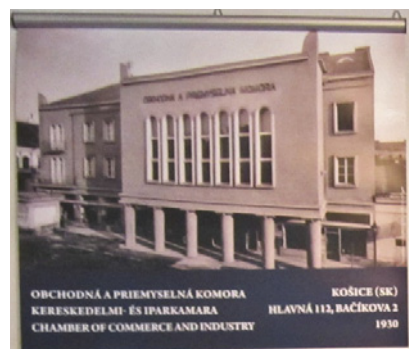
OBCHODNÁ A PRIEMYSELNÁ KOMORA KERESKEDELMI- ÉS IPARKAMARA CHAMBER OF COMMERCE AND INDUSTRY KOŠICE (SK) HLAVNÁ 112, BAČKIOVA 2 1930