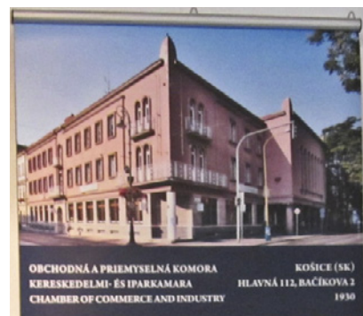
OBCHODNÁ A PRIEMYSELNÁ KOMORA KERESKEDELMI- ÉS IPARKAMARA CHAMBER OF COMMERCE AND INDUSTRY KOŠICE (SK) HLAVNÁ 112, BAČKIOVA 2 1930