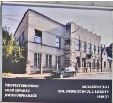
ŽIDOVSKÝ SIROTIŇEC ZSIDÓ ÁRVÁHÁZ JEWISH ORPHANAGE MUKAČEVO (UA) BUL. NEDEČÍ 29/UL. I. LOKOTY 1926 (?)