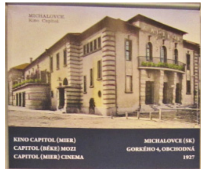
KINO CAPITOL (MIER) CAPITOL (MÉKE) MOZI CAPITOL (MIER) CINEMA MICHALOVCE (SK) GORKÉHO 4, OBCHOĽNÁ 1927