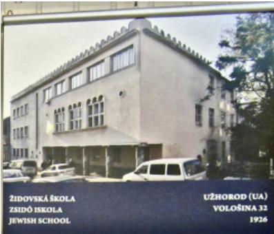
ŽIDOVSKÁ ŠKOLA ZSIDÓ ISKOLA JEWISH SCHOOL UŽHOROD (UA) VOLOŠINA 32 1926