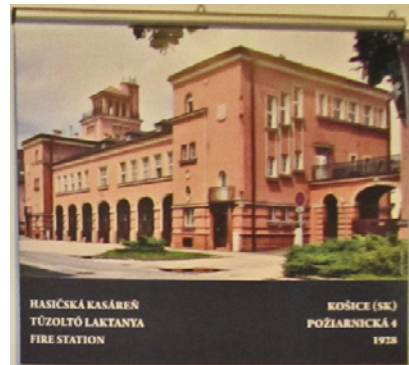
HASIČSKÁ KASÁREŇ TŰZOLTÓ LAKTANYA FIRE STATION KOŠICE (SK) POŽIARNICKÁ 4 1928