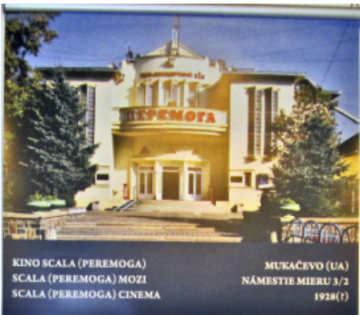
KINO SCALA (PEREMOGA) SCALA (PEREMOGA) MOZI SCALA (PEREMOGA) CINEMA MUKAČEVO (UA) NÁMESTIE MIERU 3/2 1928 (?)