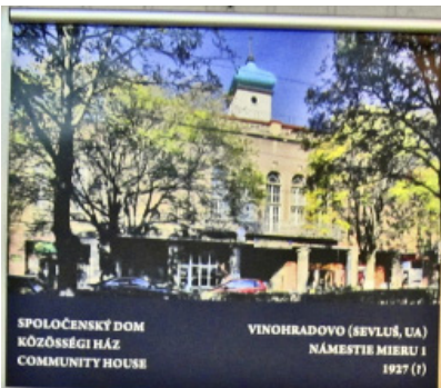
SPOLOČENSKÝ DOM KÖZÖSSÉGI HÁZ COMMUNITY HOUSE VINOHRADOVO (SEVLIV, UA) NÁMESTIE MIERU I 1927 (?)

Донедавна ім'я відомого в Словацькій Республіці архітектора Людовіта Оелшлагера (1896–1984) було знайоме небагатьом закарпатцям. А саме він – митець з великим творчим потенціалом та широкою ерудицією, чудовий фахівець будівельної справи у період міжвоєнної доби Чехословаччини (20-30 роки минулого століття) творив обличчя міст не тільки Словаччини, Угорщини, а й Закарпаття.