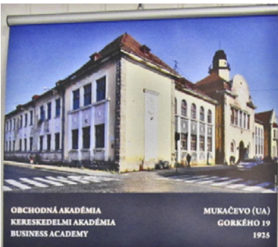
OBCHODNÁ AKADÉMIA KERESKEDELMI AKADÉMIA BUSINESS ACADEMY MUKAČEVO (UA) GORKÉHO 19 1925